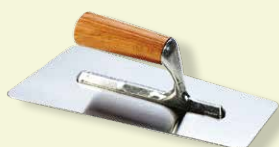
Spatule lisse 28x12 cm