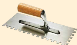
Spatule 28x12 cm dent carrée 10 mm INOX

facilement détachables, non déformables, bien secs, privés de souillures telles que crasse, huile, graisse, agent de décoffrage, laitance, efflorescences, anciens revêtements et autres traitements appliqués sur les sols. Les supports doivent être conformes aux normes en vigueur et ils doivent notamment être parfaitement plats, solides, de forme stable, sans parties facilement détachables, non déformables, bien secs, privés de souillures telles que crasse, huile, graisse, agent de décoffrage, laitance, efflorescences, anciens revêtements et autres traitements appliqués sur les sols.