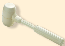
Maillet caoutchouc blanc